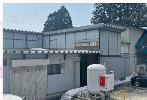
真室川工場 〒999-5301 山形県最上郡真室川町川の内720 TEL 0237-64-1037(代) FAX 0237-64-1038