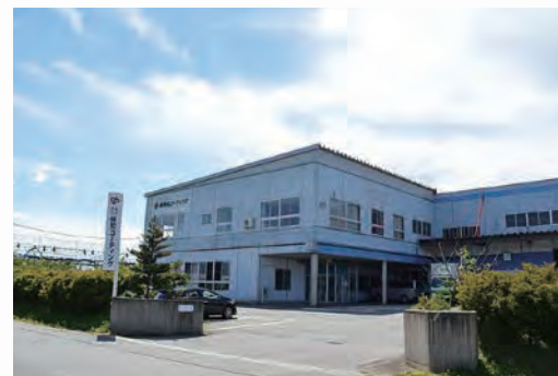
本 社 工 場 〒995-0111 山形県村山市大字大久保3987-1 TEL 0237-42-4355(代) FAX 0237-42-4366